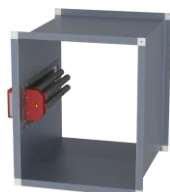
Esimerkkikuvat: Ilmakanavaan asennettu järjestelmä